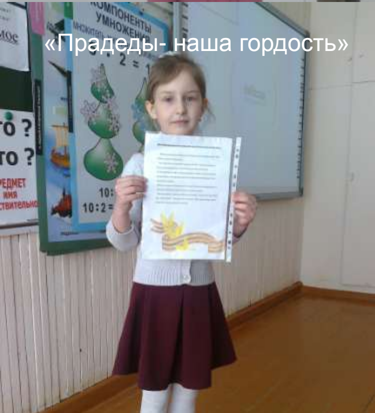
«Прадеды- наша гордость»