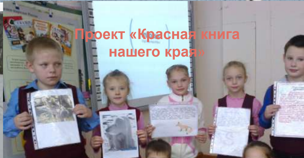
Проект «Красная книга нашего края»